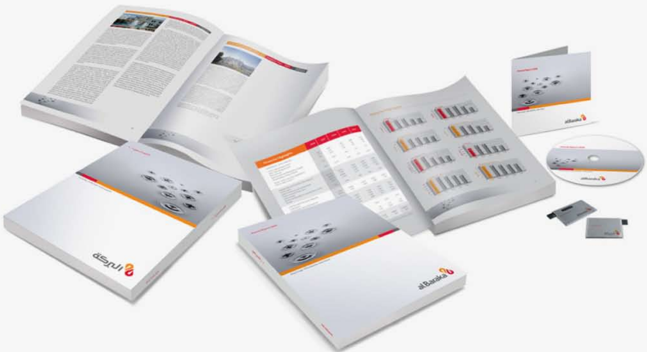
Annual report 2009

Visuals creativity behind Al Baraka Annual Report 2009 and its related items like CD and USB give aways.