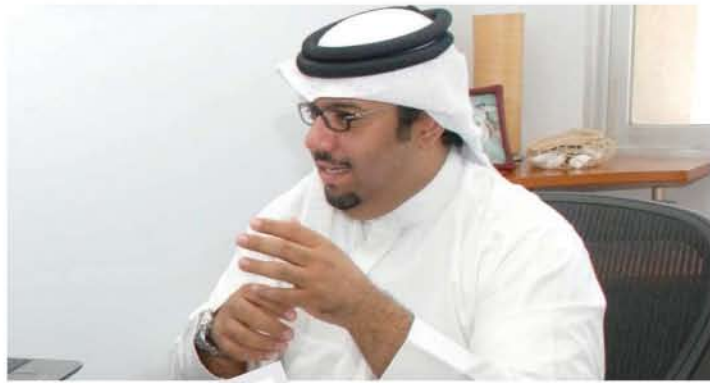
كان يقابل الشركات المحلية والعالمية وشركات الاتصالات

عكس هذا الانخفاض يؤكد عبد الله أن تسوية هيكل الإنفاق الإعلاني التسويقية التابعة لمجموعة هكلم القطاع الأقل في هذا الربع قياساً بتاريخ الشركة، وهو يعتبر ذلك امتداداً في ظل الظروف الاقتصادية القاسية، إذ يقول: عندما إلى تقليص الإنفاق من الميزانية وتوجيه الميزانية إلى قنوات أخرى. شهدت خروج عدد من الصحف من السوق.