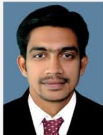
Rafeeq Client Servicing Dept