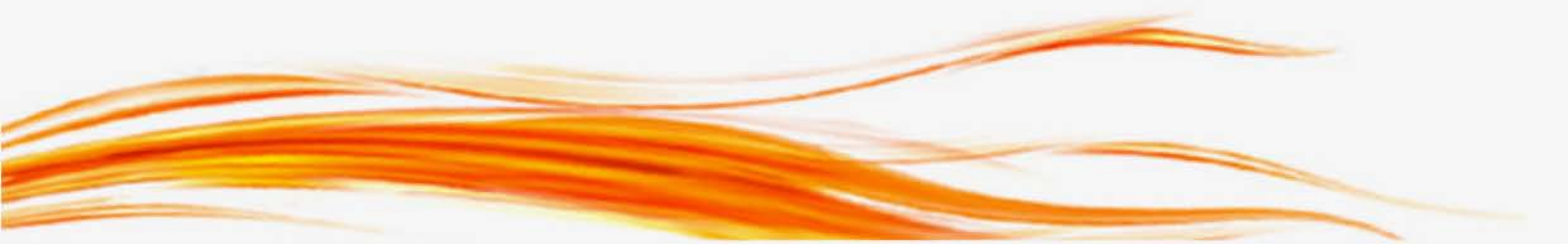
AGM Summary Booklet